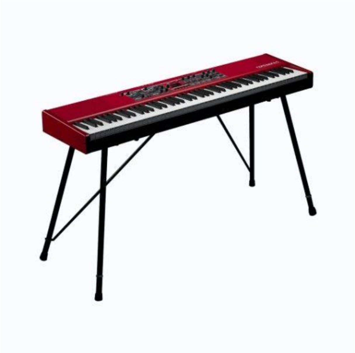
NORD piano 5 88