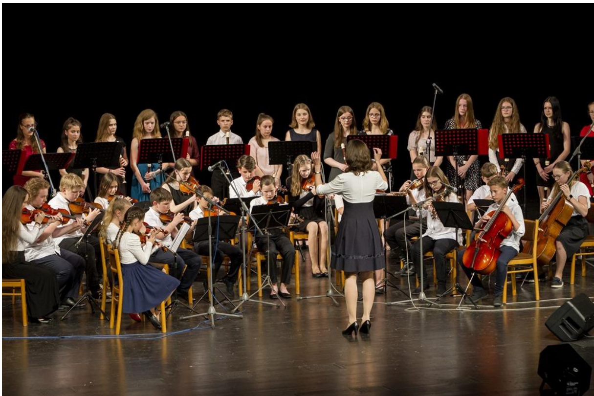
Benefiční koncert ZUŠ

Benefiční koncert – ZUŠ Open – květen 2022 - ve spolupráci s oblastní Charitou – na pomoc uprchlíkům z Ukrajiny – výtěžek - 36 456,- Kč