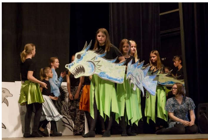
Představení Luna a kouzelná flétna

Na jaře byly do výuky zařazeny 2 děti ukrajinských uprchlíků. Obě se před tím, než s rodiči opustily, z důvodu válečného konfliktu Ukrajinu, vzdělávaly v podobném typu školy (hra na kytaru a klavír).