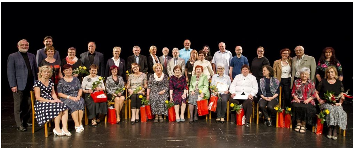
Absolventi hudebního oboru – Akademie pro seniory