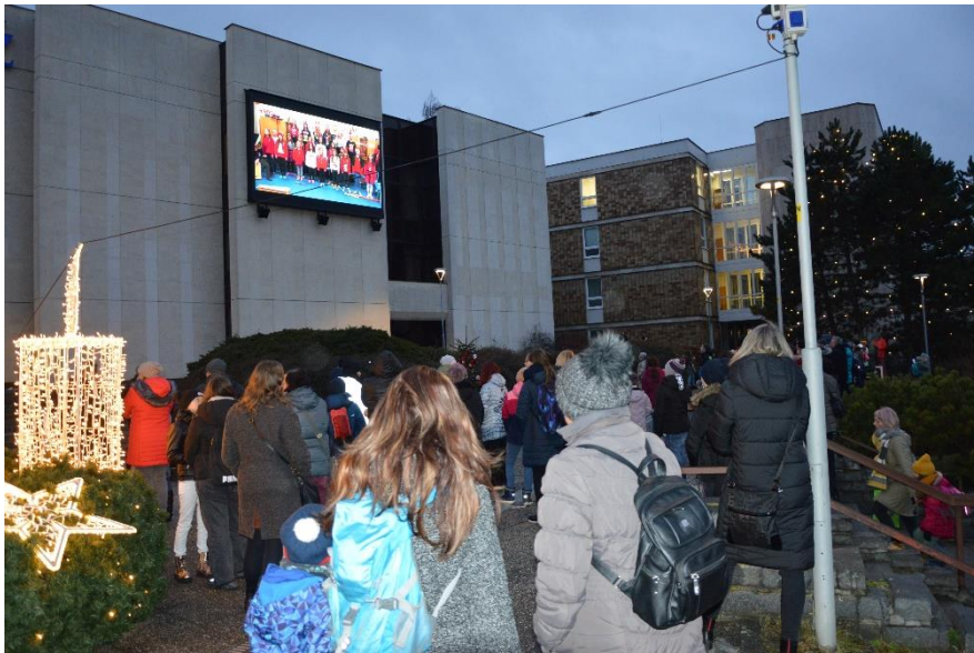
Vánoční open air koncert ZUŠ

Benefiční koncert – ZUŠ Open – květen 2022 - ve spolupráci s oblastní Charitou – na pomoc uprchlíkům z Ukrajiny – výtěžek - 36 456,- Kč