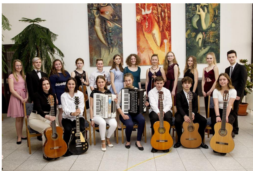
Absolventi hudebního oboru – Absolventský koncert V.