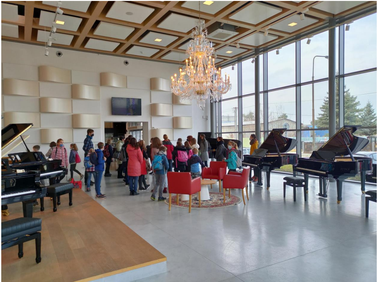
Exkurze do firmy Petrof