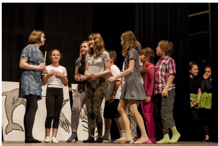
Představení Luna a kouzelná flétna

Vyřazení absolventů VO a LDO – květen 2022 – foyer Pasáž