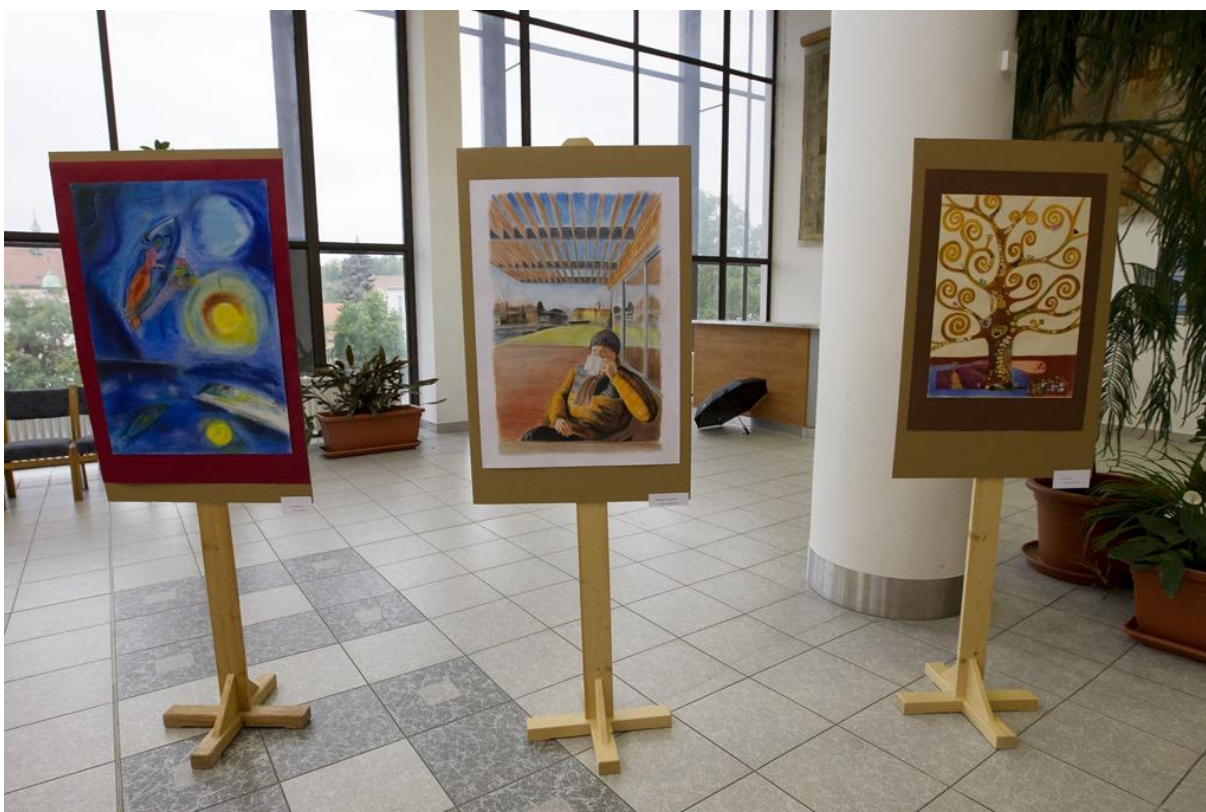
Výtvarné práce absolventů Akademie pro seniory