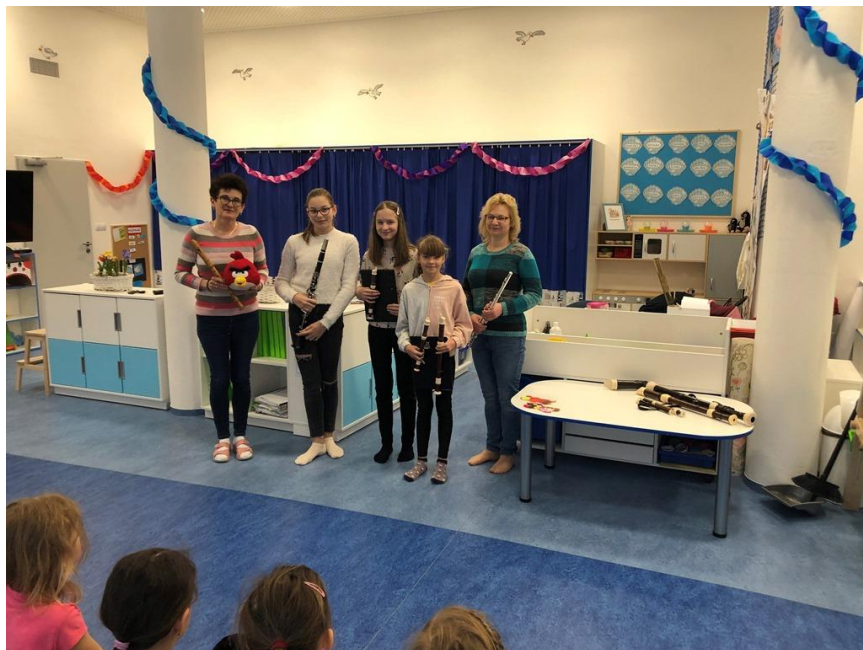
Workshopy v MŠ

Workshopy a projekty pro MŠ a ZŠ – v průběhu školního roku se konalo 20 workshopů pro MŠ a ZŠ. Řada z nich proběhla přímo v prostorách MŠ nebo ZŠ. Mezioborový projekt pro ZŠ (HO, TO, LDO, VO) – Luna a kouzelná flétna – květen – kino Pasáž. Taneční představení pro ZŠ (TO, LDO) – Do světa mýtů a pohádek – červen 2022 – divadlo Pasáž.