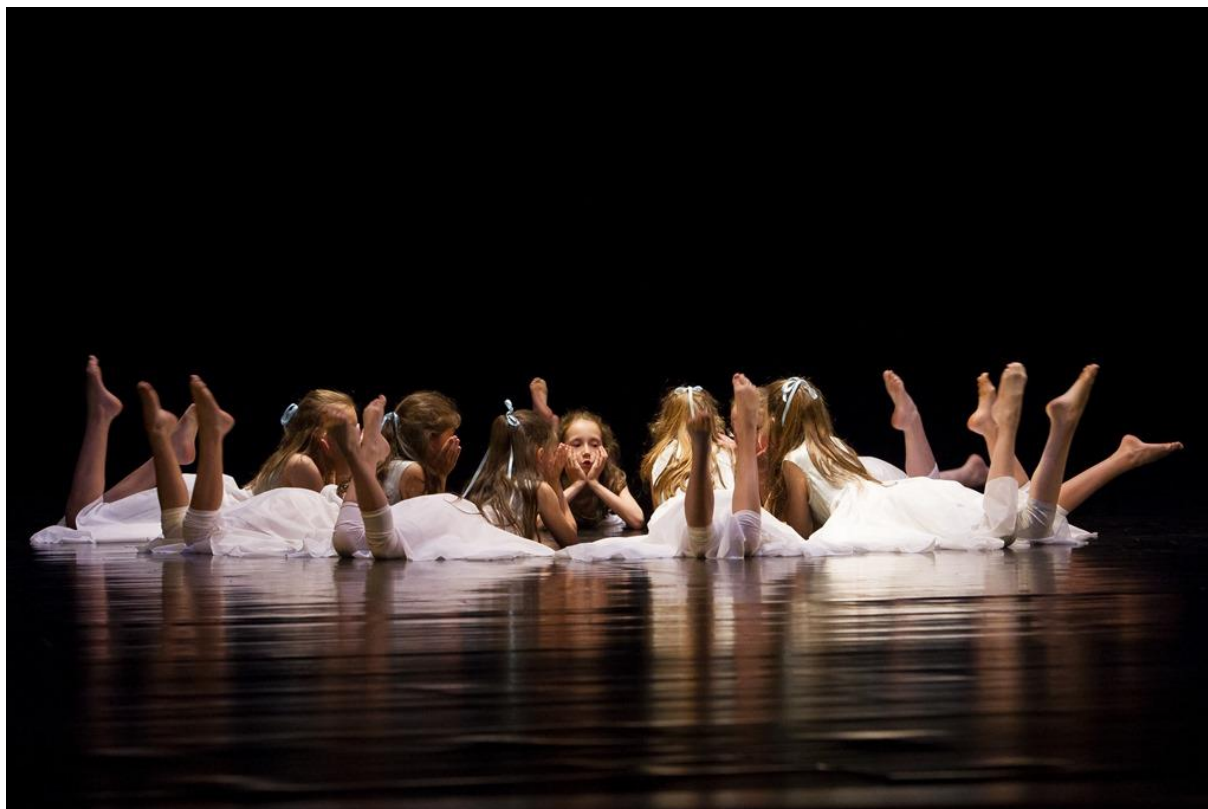
Představení Do světa mýtů a pohádek

Všichni zájemci prošli přijímacím řízením před zkouškovými komisemi a byli zapsáni do přijímacích protokolů. Starší žáci, kteří prokázali předpoklady ke studiu na základní umělecké škole, byli zařazeni do vyšších ročníků prvního či druhého stupně.