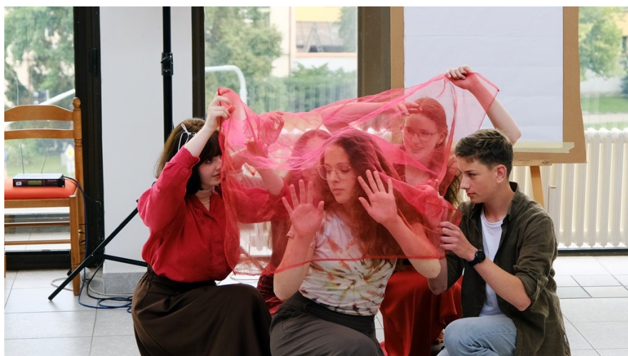
Slavnostní ocenění talentovaných žáků třebíčských škol – vystoupení žáků LDO