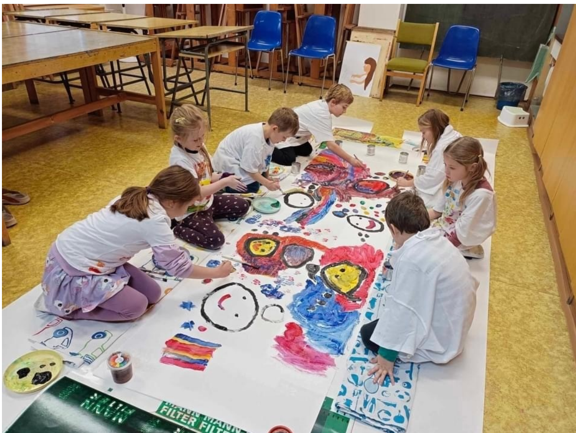
Malý umělec v tvůrčím světě