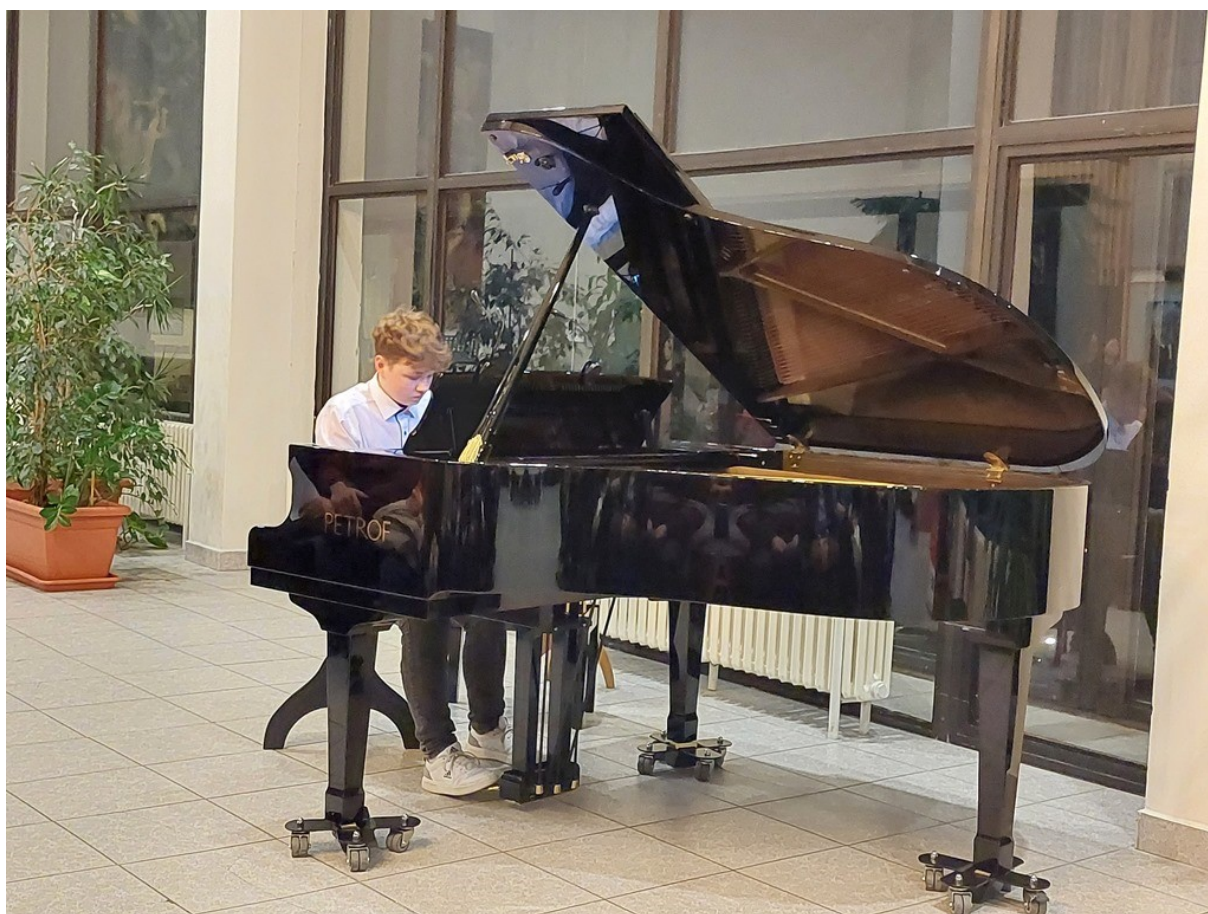
Benefiční koncert ve spolupráci s Oblastní charitou

Všichni žáci, kteří získali 1. místo, postupují do okresního kola soutěže.