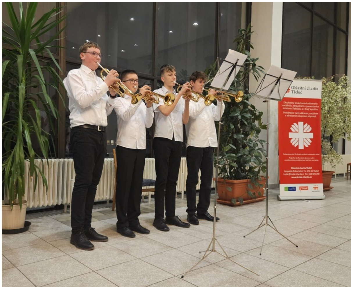
Benefiční koncert ve spolupráci s Oblastní charitou