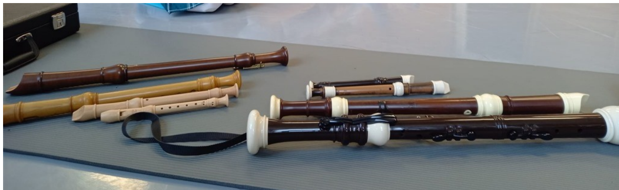
Výstava hudebních nástrojů – zobcové flétny