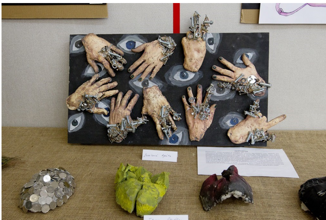
Výstava prací absolventů výtvarného oboru