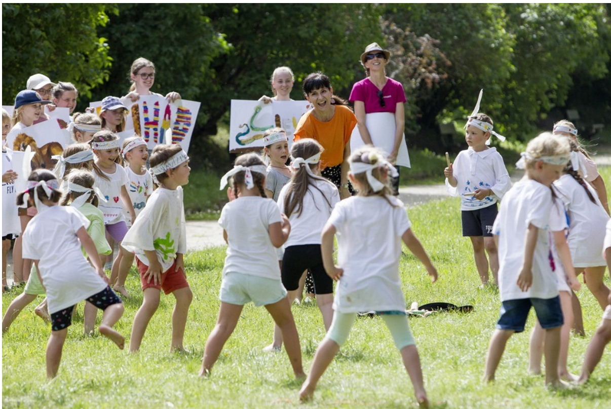
Malý umělec v tvůrčím světě – Těšíme se na prázdniny