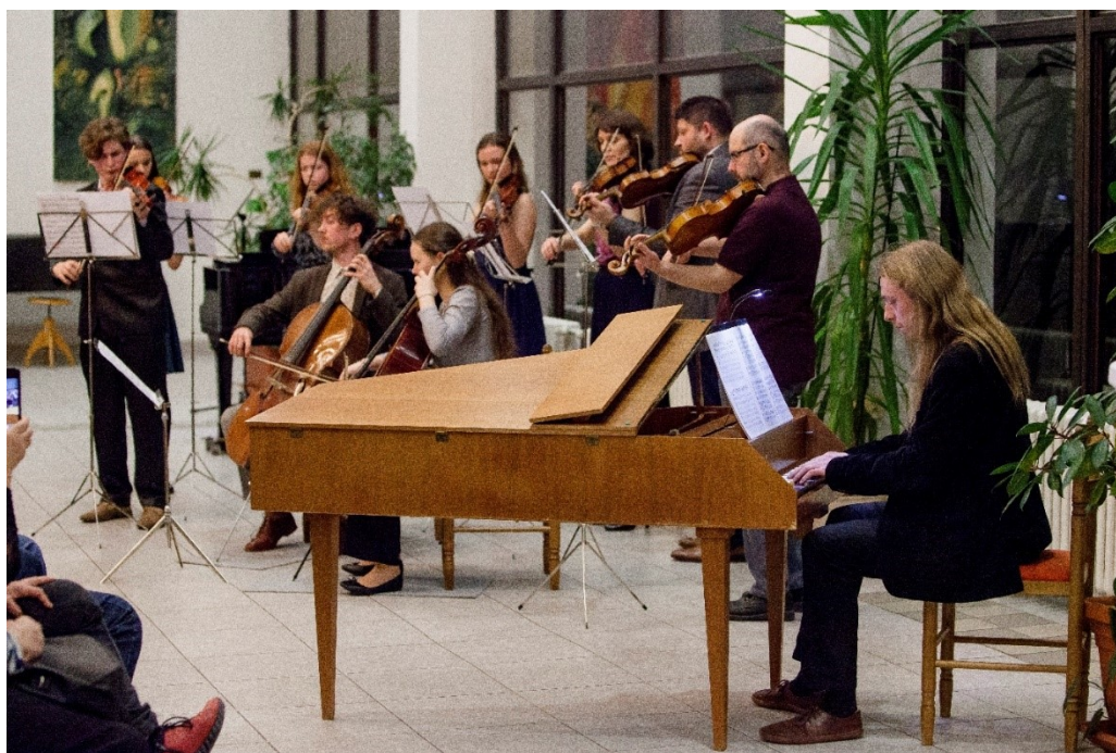
Koncert smyčcového oddělení

Pro školní rok 2024/2025 jsme otevřeli nové studijní zaměření skladba, do kterého byl přijat jeden student.