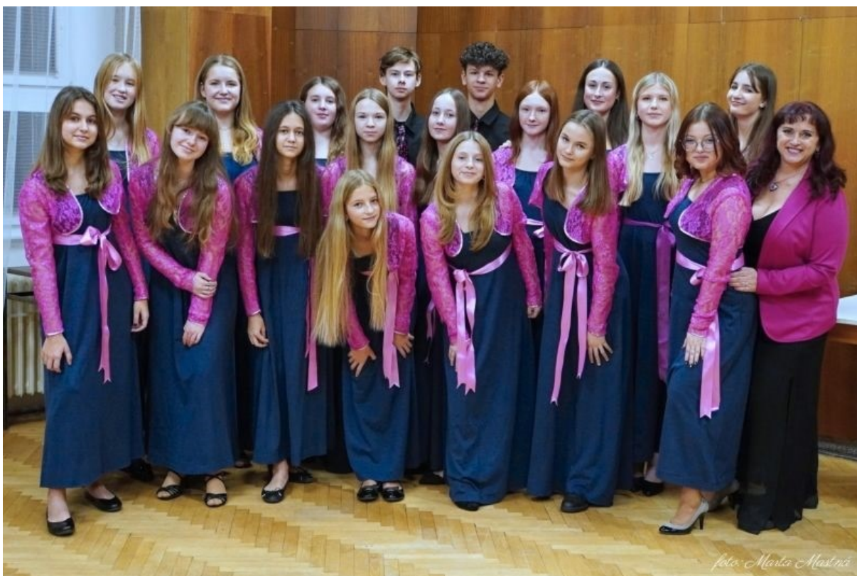
Dětský pěvecký sbor Resonance