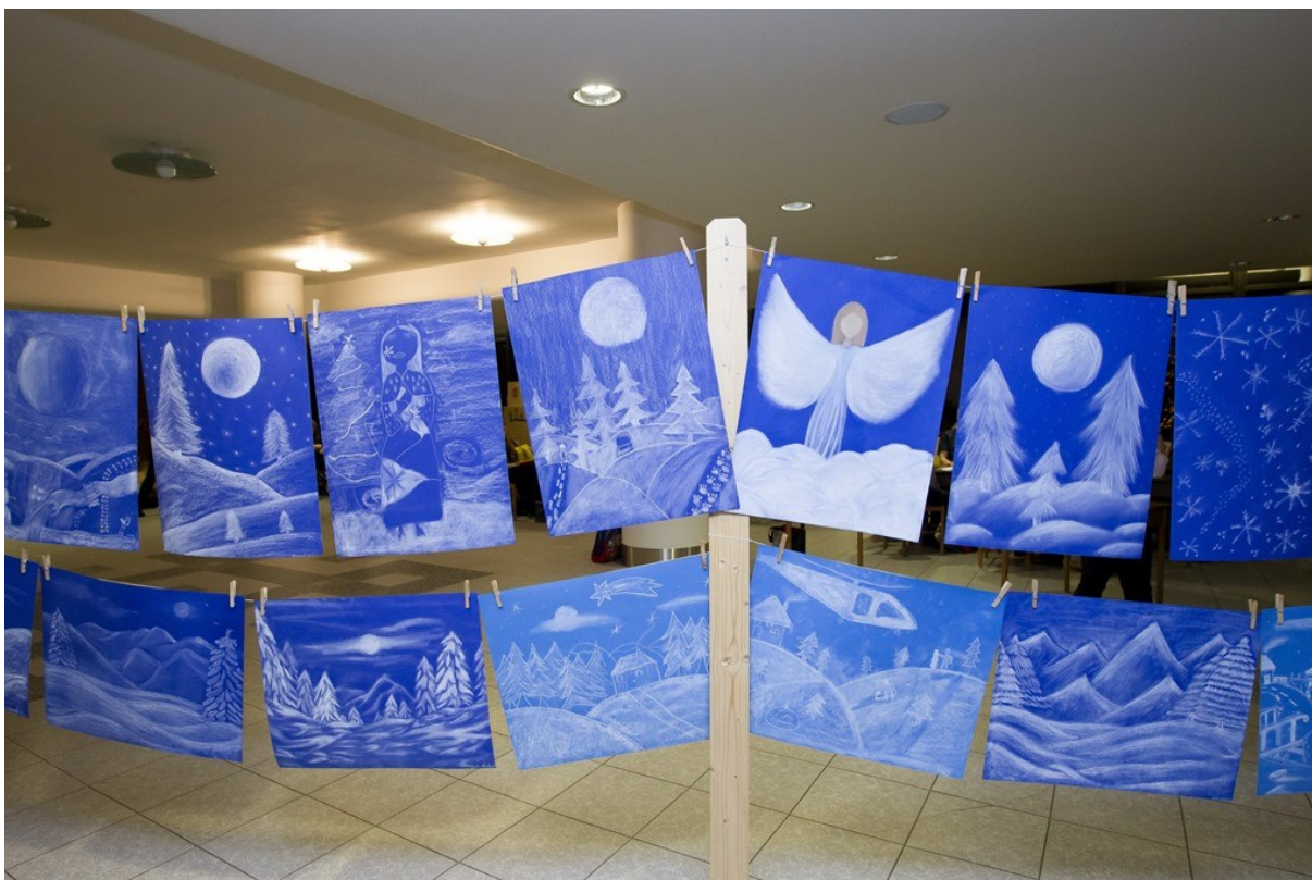
Výstava výtvarných prací žáků ZUŠ – Vánoční koncert