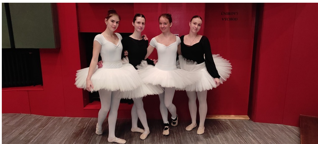
Z představení „Letem světem“ pro děti ze ZŠ

U studia pro dospělé se tvoří vzdělávací obsah jednotlivých vyučovacích předmětů individuálně pro každého žáka. Hodinové dotace odpovídají učebním plánům pro základní studium II. stupně.