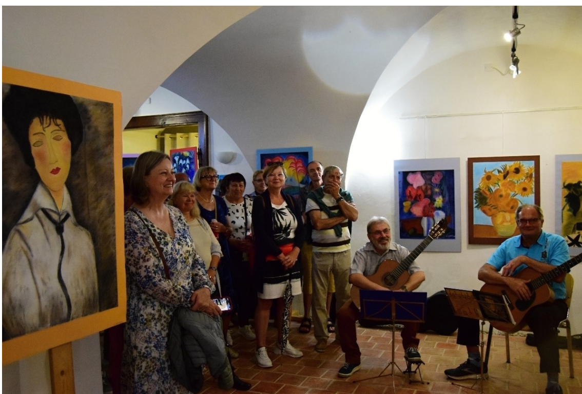
Vernisáž výstavy výtvarných prací studentů Akademie