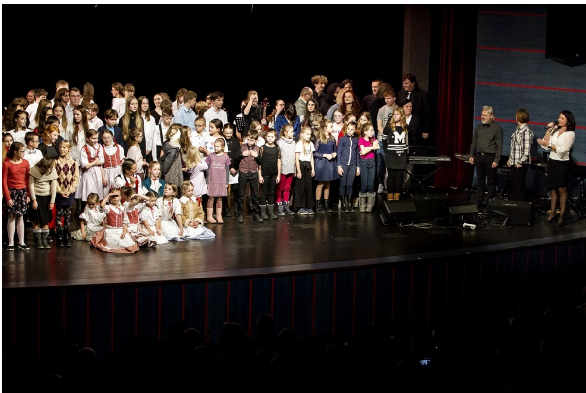
Vánoční koncert ZUŠ – závěrečný společný zpěv