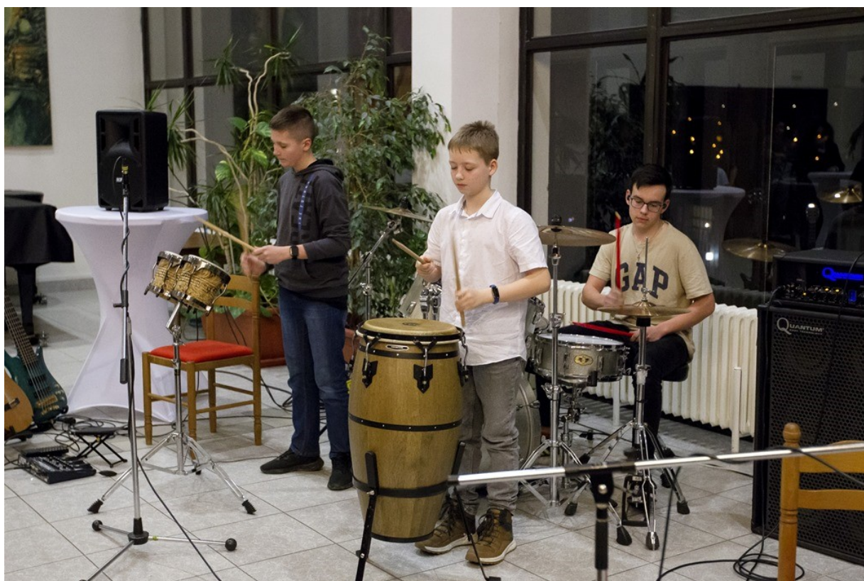
Koncert oddělení strunných a bicích nástrojů