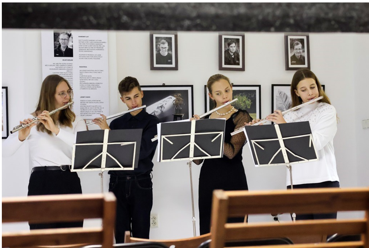
Vystoupení žáků ZUŠ na vernisáži fotografií