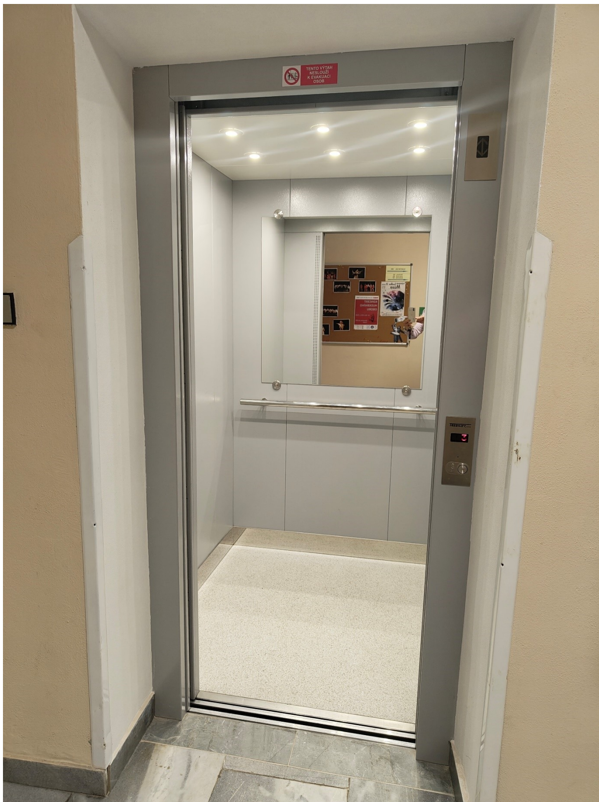
Nový výtah v budově ZUŠ – Fórum